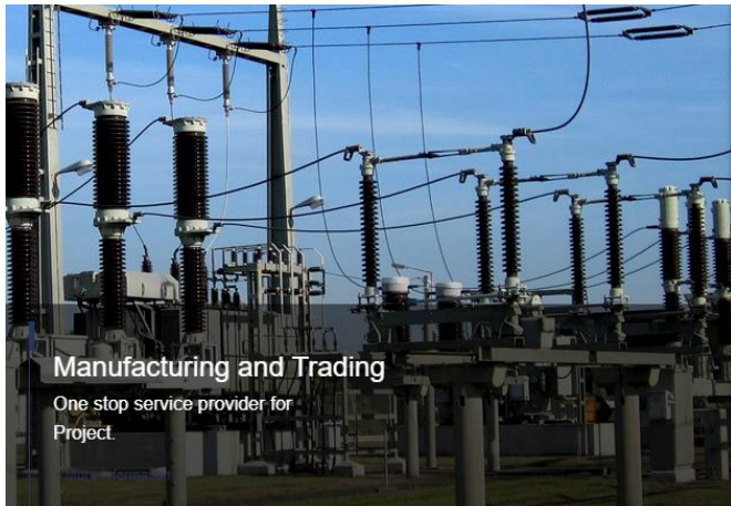
Manufacturing and Trading

2Q19 บริษัทฯ มีรายได้จากการขาย 679.15 ล้านบาท +23.96% YoY เติบโตจากการได้รับแต่งตั้งเป็นผู้แทนจำหน่ายอุปกรณ์ไฟฟ้าให้กับภาครัฐเพิ่มขึ้น รายได้จากการขายไฟฟ้าและส่วนเพิ่มราคาซื้อขายอยู่ที่ 917.41 ล้านบาท +108.53% YoY โดยรายได้ที่เพิ่มขึ้นเกิดจากการจำหน่ายไฟฟ้าจากโรงไฟฟ้ากังหันลมครบทั้ง 3 โครงการ รวม 170 เมกะวัตต์ รายได้จากการรับเหมาก่อสร้างและให้บริการอยู่ที่ 373.40 ล้านบาท -69.88% YoY ลดลงค่อนข้างมากเนื่องจากรายได้ปีก่อนมีฐานที่ค่อนข้างสูงจากการก่อสร้างโครงการโรงไฟฟ้ากังหันลมและได้รับรู้รายได้เสร็จสิ้นแล้ว อย่างไรก็ตามปัจจุบันทางบริษัทฯ ได้เข้าซื้อกิจการบริษัท ฟิวเจอร์ อีลีคทริคอล คอนโทรล จำกัด (“FEC”) ตั้งแต่เดือนกรกฎาคมในปีที่ผ่านมา โดยเข้าร่วมประมูลงานก่อสร้างจนถึงปัจจุบัน มี Backlog ประมาณ 7,000 ล้านบาท ซึ่งจะทยอยรับรู้เป็นรายได้ตั้งแต่ไตรมาส 3 ปี 2562 ไปจนถึงปี 2564 โดยผลการดำเนินงานในภาพรวมสำหรับงวดหกเดือน สิ้นสุดวันที่ 30 มิถุนายน 2562 มีผลกำไรสุทธิที่ 661.88 ล้านบาท