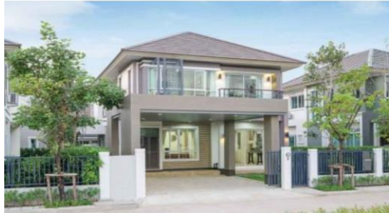
บ้านเดี่ยว