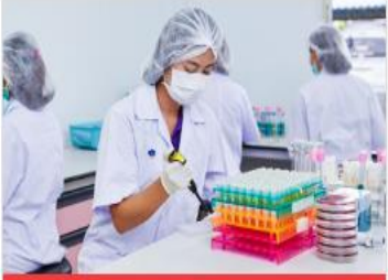
สายธุรกิจอื่นๆ

บริษัทไทยฟู้ดส์ กรุ๊ป เป็นผู้ผลิตอาหารแบบครบวงจรที่มีความเชี่ยวชาญในการผลิตไก่และสุกร โดยมีการดำเนินธุรกิจทั้งในประเทศไทยและประเทศเวียดนาม ซึ่งสามารถแบ่งสายผลิตภัณฑ์ได้ ดังนี้