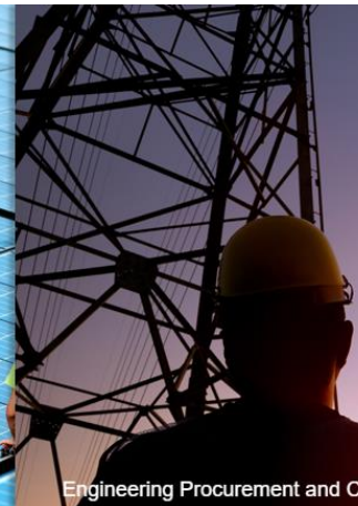
Engineering Procurement and Construction