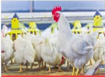
สายธุรกิจไก่