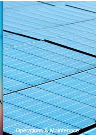
Operations & Maintenance