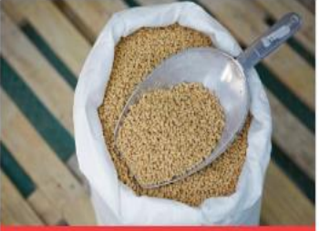
สายธุรกิจอาหารสัตว์