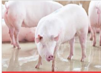
สายธุรกิจสุกร